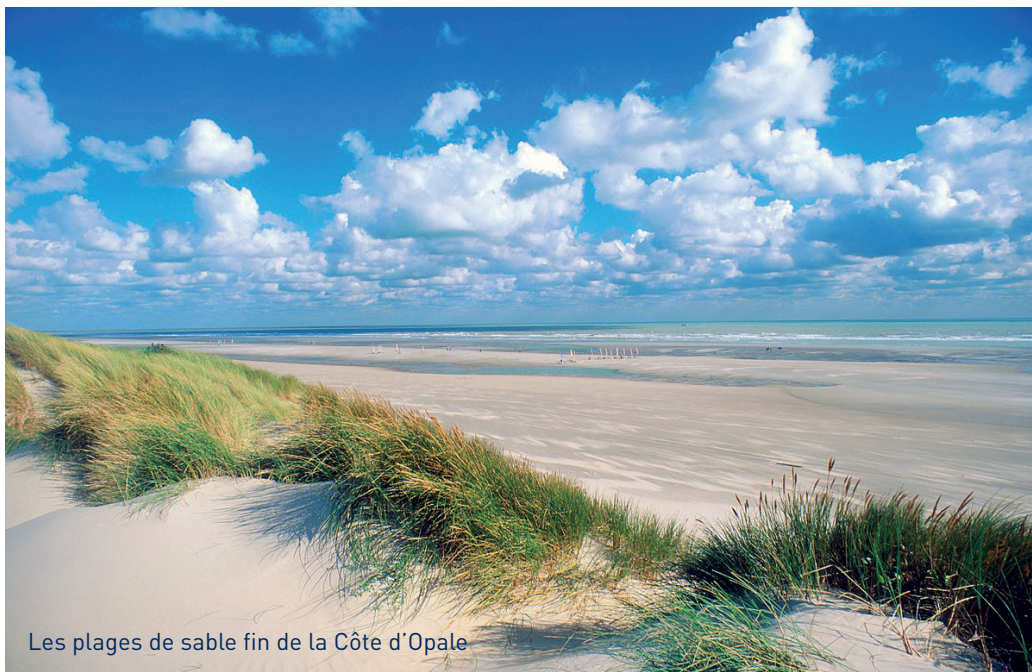
Les plages de sable fin de la Côte d'Opale